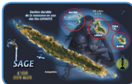
page d'accueil du site SAGE