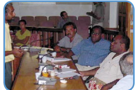
Présentation du programme au Président et aux élus de la Province des îles