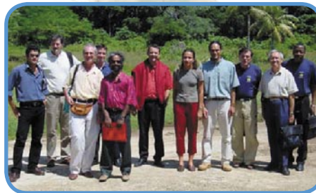
Les chefs de projet