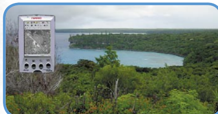
Des relevés sur le terrain, transmis par internet