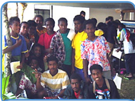
Les jeunes de Maré s'intéressent à l'environnement