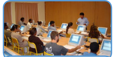
Nouméa, formation STG