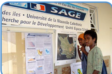
La fête de la science à l'IRD

Comme chaque année depuis maintenant 11 ans, la Fête de la Science a permis aux scolaires et au grand public de se rapprocher et de s'intéresser aux domaines scientifiques. Le programme SAGE était présent dans le cadre des journées « portes ouvertes » à l'UNC et à l'IRD ainsi qu'au collège de Tadine.